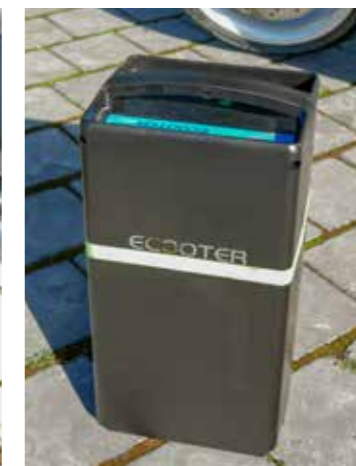
De sterke 60V/32Ah accu weegt 11,6kg