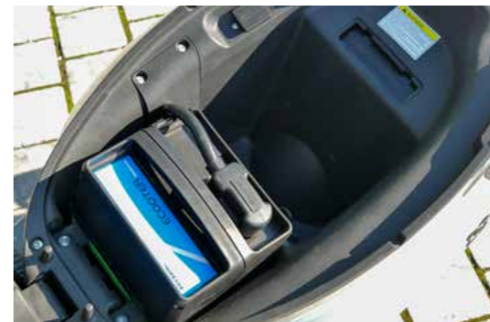
Naast de accu is er nog plek voor wat kleine spullen