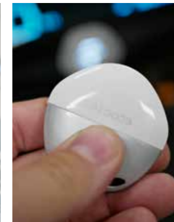
Uniek! Standaard keyless go