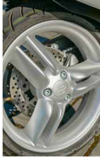
Fraaie zesspaaks wielen