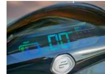
Compleet digitaal display, let op de centrale startknop

We draaien er dit keer niet omheen: wat ziet deze Eco er goed uit! Het design doet ons denken aan de Bolt scooter, die inmiddels als Etergo door het leven gaat. Het zal AGM worst wezen: die Etergo zien we vandaag de dag nog steeds niet op de openbare weg, terwijl deze AGM al bij dealers staat... Toch is het geen regelrechte kopie, want houden we de modellen naast elkaar dan zijn de verschillen toch aanzienlijk. Een echte eyecatcher van deze Eco is de enkelzijdige voorwielophanging. Niet alleen makkelijk wanneer er een band gewisseld moet worden, het geeft ook vrij zicht op de fraaie 12" zesspaaks wielen. Het zijn niet alleen de wielen die opvallen, kijk ook maar eens naar de leuk vormgegeven koplamp (geheel LED) of de vouw die gestroomlijnd van de treeplank doorloopt in de achterzijde. Aan de achterkant zien we een brede