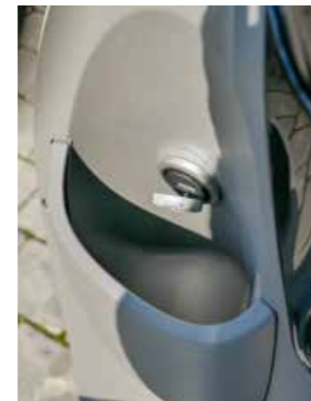
Open opbergvak met USB poort