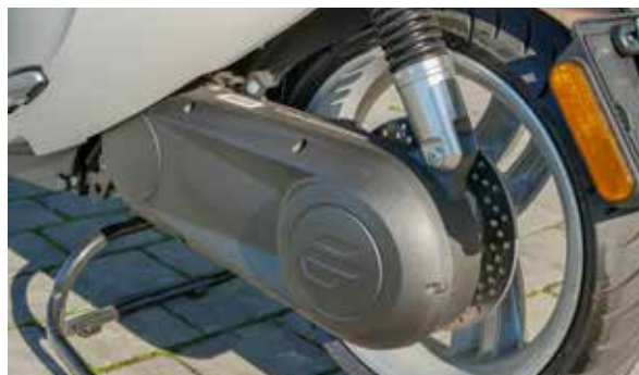
Centraal geplaatste motor, aandrijving wordt overgebracht door een snaar