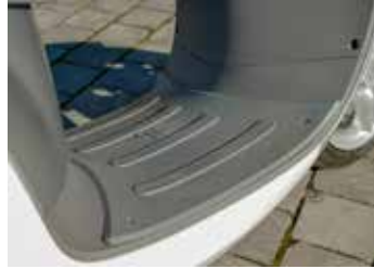
Geheel vlakke treeplank

zijn er twee wegklapbare stepjes gemonteerd. Onder het zadel treffen we de uitneembare 60V/32Ah accu aan. De gebruikte stekker is simpel maar doeltreffend, eenmaal de accu in je handen heb je een gewicht van 11,6kg vast. Opladen doe je door middel van de bijgeleverde lader in 4,5 tot 6 uur. Men belooft voor de snorversie een actieradius nét over de 100 kilometer. Wij hebben de scooter niet ontzien, hebben veel moeten remmen en accelereren en kwamen zo'n 80 kilometer ver. Een geweldige score waar veel concurrenten zich op stuk bijten... Met de accu onder het zadel blijft er genoeg ruimte over voor een set handschoenen, en wanneer je de lader thuis laat ook nog voor wat extra's. Onder het stuur komen we nog een open vakje tegen met hierboven een USB lader, ook een tassenhaakje is present. Je zou het bij zo'n lichte scooter (79kg zonder accu) misschien niet verwachten, maar ook aan de achterzijde treffen we een schijfrem aan. Samen met de schijfrem aan het voorwiel en de prettig aanvoelende remhendels hebben we ook qua 'remvermogen' geen reden tot klagen.