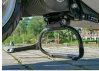
Zelfs de middenbok is eigentijds vormgegeven