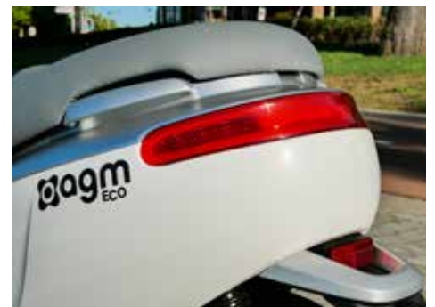
Rond en volledig LED, de achterzijde van de Eco