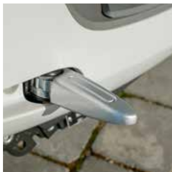
Uitklapbare stepjes voor je passagier